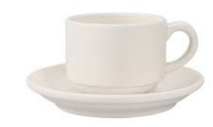
Stackable Tea/Coffee Cup & Coupe Saucer