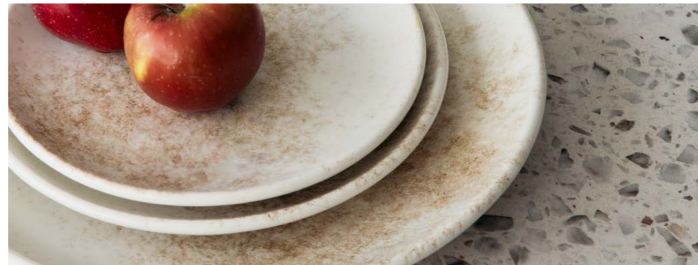
SMOKY Matte Brown