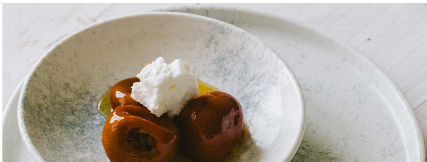
SMOKY Matte Blue