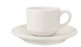
Stackable Coffee Cup & Coupe Saucer