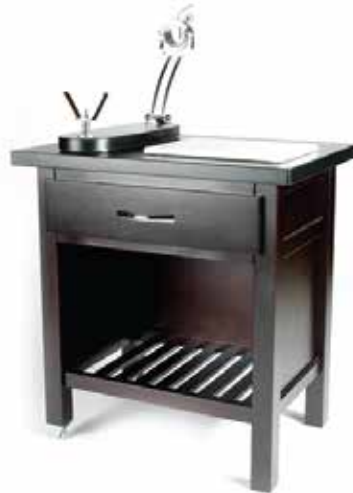
MESA JAMONERA MEDIANA. 600x800