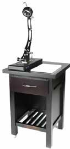
MESA JAMONERA PEQUEÑA. 600x600