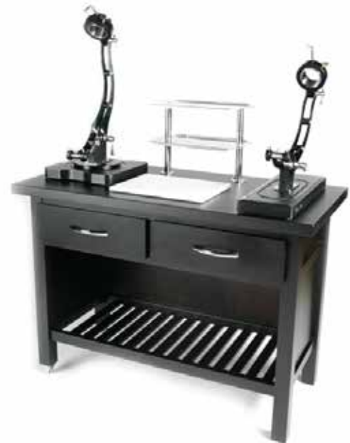
MESA JAMONERA GRANDE. 600x1200