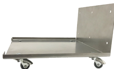
Soporte completo con ruedas